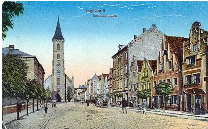
Abb. 1: Ingolstadt, um 1915