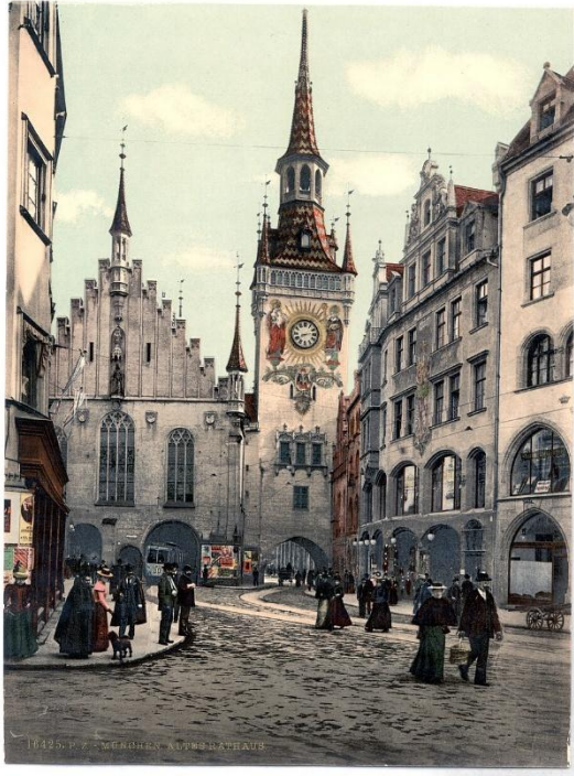
Abb. 3: München, Marienplatz, 19. Jahrhundert