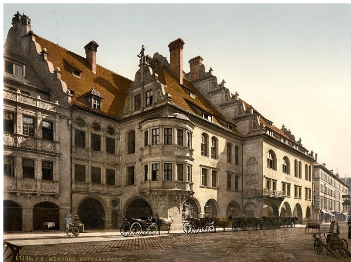
Abb. 2: München, Hofbräuhaus, 19. Jahrhundert

Bei dem Eintritt sahen sie eine ganze Tafel voll Gäste. Der Wirt begegnete ihnen mit aller Freundlichkeit und bot ihnen Lehnstühle an. Die Spielleute weigerten sich und entschuldigten sich, dass sie aus Mangel des Geldes nicht mithalten konnten. »Hier ist alles zechfrei«, antwortete der Wirt, »meine Herren, essen und trinken Sie solange als es ihnen gefällig ist.« Der Antrag gefiel den Spielleuten. Sie setzten sich nieder, aßen und tranken. Der Wirt sprach ihnen zu und befahl ihnen mit nach Hause zu nehmen, was sie nicht genießen konnten. Sie schoben also einen guten Teil einer Pastete in den Sack. Sie packten Gänse, Rebhühner, Enten und andere niedliche Speisen ein. Endlich fingen sie auf ihren Geigen zu spielen und alle Leute zu tanzen an. Was geschieht? Auf einmal verschwindet das ganze Gartenhaus, und meine vier Spielleute sitzen jeder auf einer Säule des Galgens. Leute, die vorübergingen, sagten, es hätte vier Uhr geschlagen und man hätte bereits Angelus Domini geläutet. Die Spielleute stiegen von ihrem Thron herab, gingen nach Hause, und als sie die eingepackten Speisen herauslangen wollten, fanden sie nichts als Mist und Kot in der Tasche. Die Historie ist richtig und man erzählt sie in allen Bierschenken. Meine Herren Hexenleugner, was sagen Sie hierzu? Sie mögen sagen, was sie wollen, mir werden sie wohl niemals mehr glauben machen, dass es keine Hexen gibt.