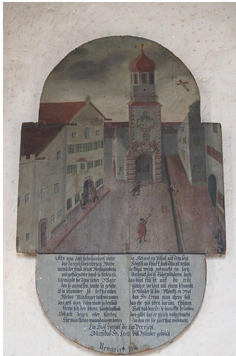
Abb. 5: Weilheim